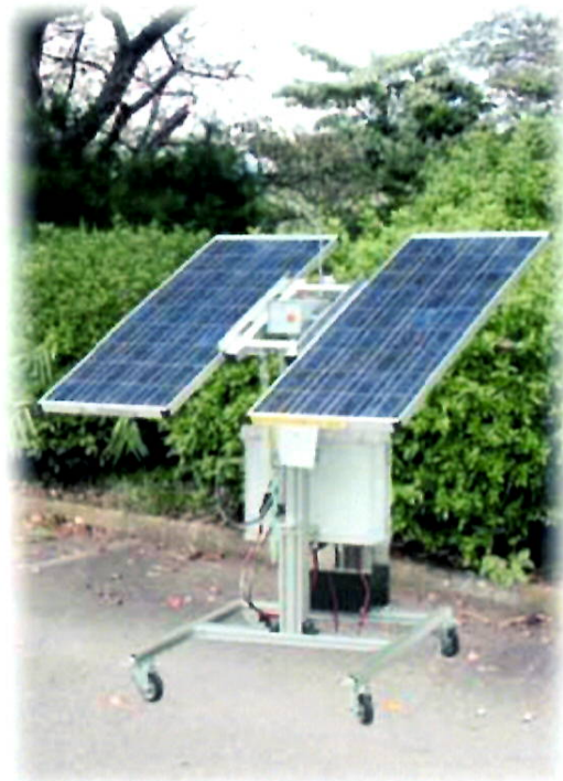
〈追尾型と固定型の発電量の比較〉